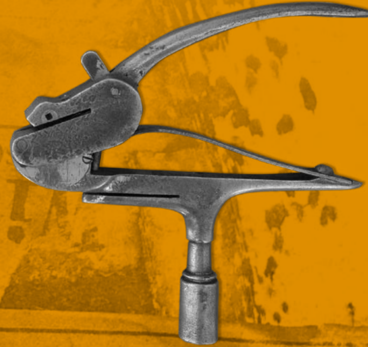
Schaffnerzange mit Vierkantschlüssel.