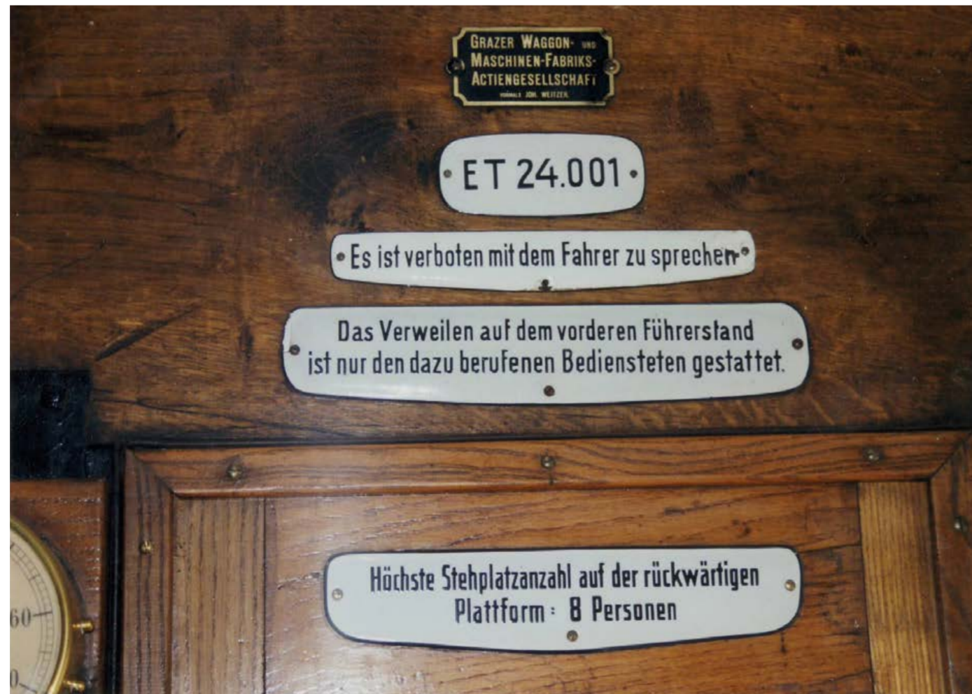
Mit Emailleschildern wurde das Verhalten der Fahrgäste bestimmt.