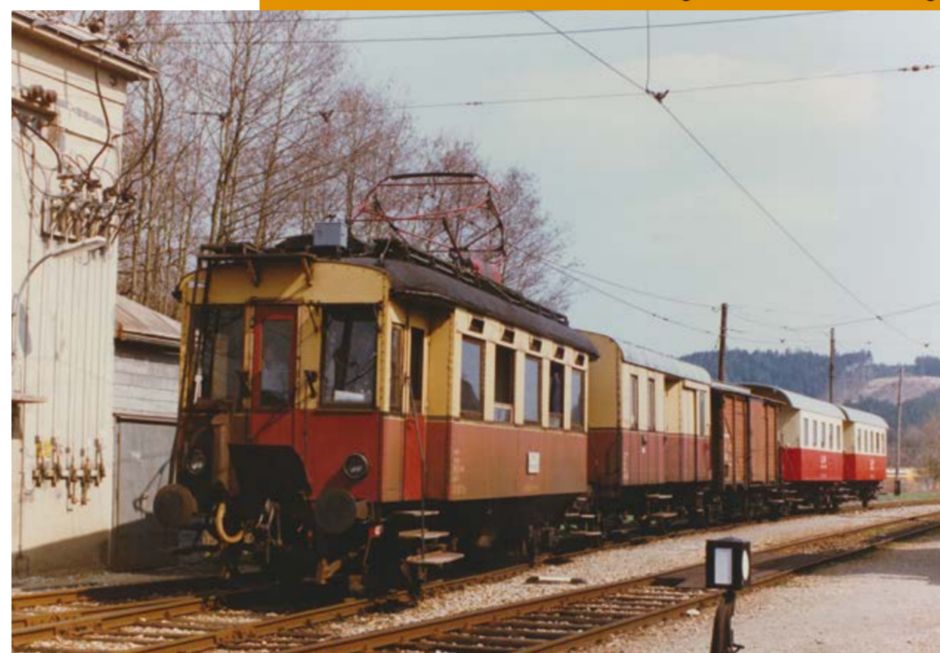
Personenzug mit Post-, Stückgut- und Personenwagen in Bachmanning.